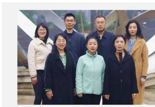
教研室团队成员合影