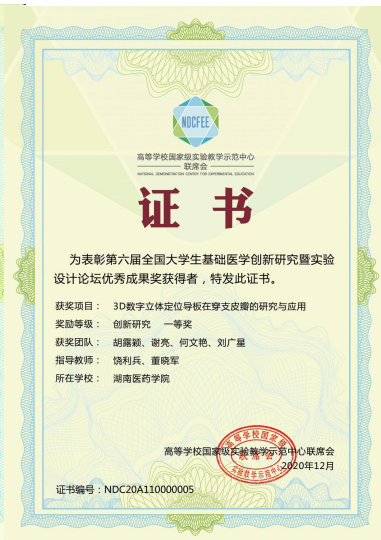
部分学生获奖证书