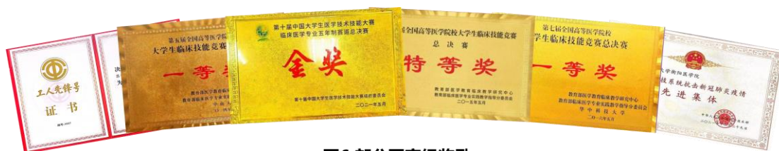
图6 部分国家级奖励

获得全国大学生医学技术技能大赛特等奖、金奖和一等奖总数排名全国第 5（图 6）。麦可思调查显示，近两年南华大学医学生临床基本能力、批判思维能力、职业素养等增值比例分别达到 94%、90%和 95%。新冠疫情期间近 3000 名医学生主动请战，体现了责任与担当。涌现了中国大学生自强之星、国家奖学金和国家励志奖学金获得者、湖南省首届最美大学生等先进典型近 2000 人次。